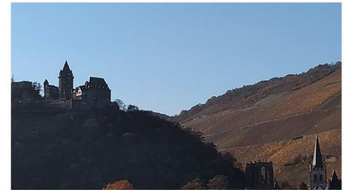
Castillos y viñedos a lo largo del Rhein