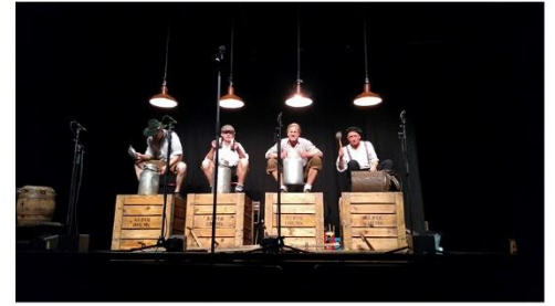
Concierto de los Alpin Drums