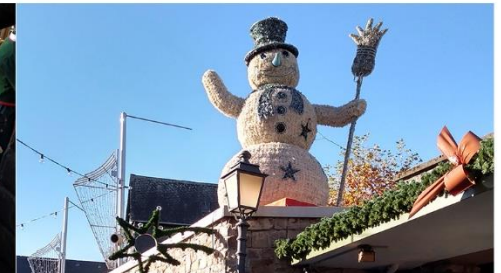
Mercado de Navidad de Rüdesheim am Rhein