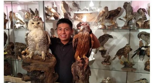
Suiza: Raclette, chocolate y visita a un museo privado de aves.