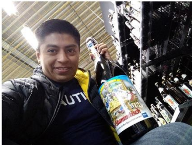
Visita a una tienda de bebidas en Darmstadt