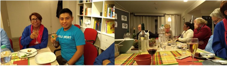
Visita de alcaldesa de Masatepe y presidenta de la AAMGG